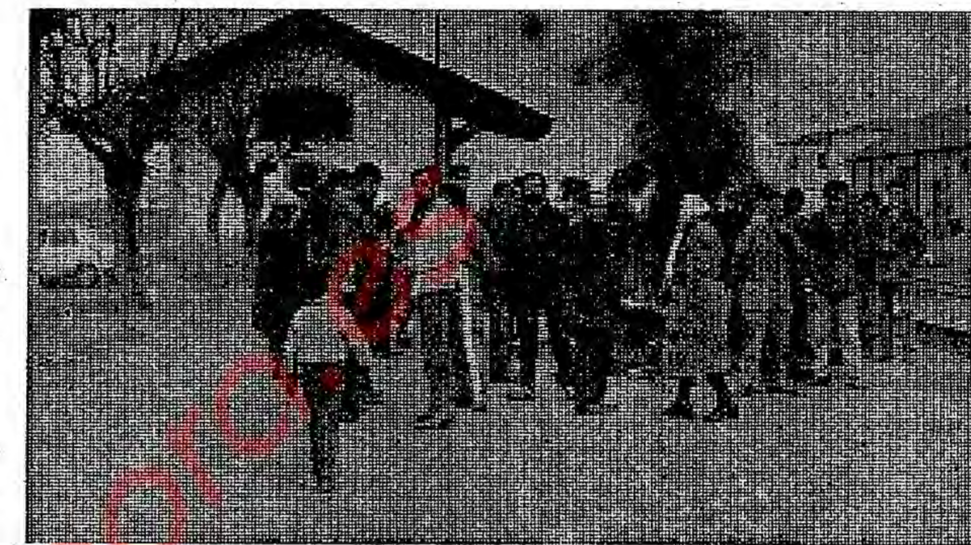
Un grupo de vecinos calentándose con viejas traviesas.

Por la tarde, hubo diversos grupos esparcidos por los andenes de la estación, sin que en ningún momento la Guardia Civil interviniera para nada. Ya en la noche comenzó a arder la caseta del guardaagujas, que había sido volcada el día anterior, produciéndose un clima de tensión, ya que se corrió la voz de que dentro de la caseta había una bombona de gas butano.