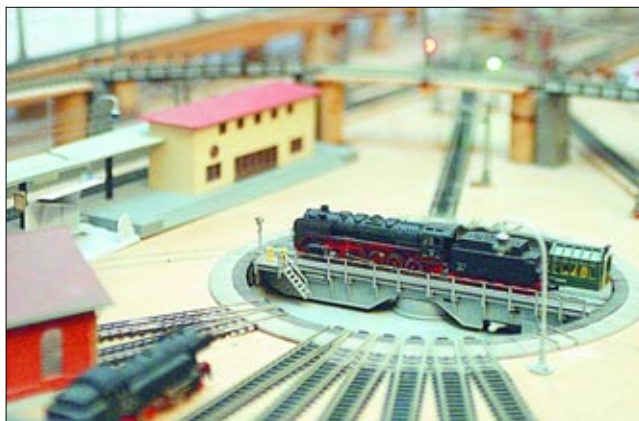
La reproducción a escala es tan completa que hasta dispone de una rotonda