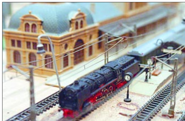
Una de las máquinas de vapor de la colección de Luis Cortés en la maqueta

presentación de lo que tuvimos circulando por nuestras vías. En otros países de Europa, como Suiza o Alemania, conservan muchas en diferentes exposiciones y algunas las usan todavía, por ejemplo para subir a las montañas».